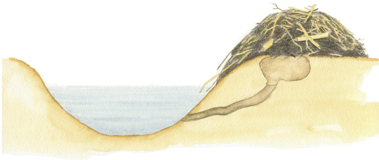
Afbeelding 2: Beverburcht.